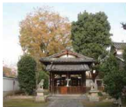
図2 ならまちの社寺林 (奈良市緑の基本計画より)