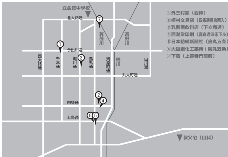
図7 京都におけるK氏の軌跡

K氏は職場を転々とし、4年のあいだに少なくとも7つの仕事に就いている(図7、後掲表4)。ここでは彼の就労の不安定さと苦学の様子をみるために、その仕事の内容や転職の動機・プロセスなどを見よう。