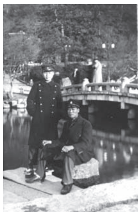
図4 学窓時代のK氏ら

K氏はその後、1944年11月から1946年6月まで、S里の近くの金融組合書記として働いた（図5）。