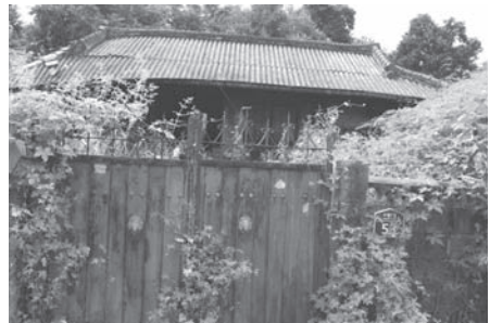
図3 K氏の自宅