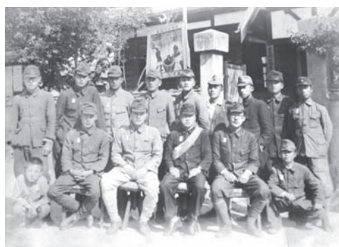
図5 金融組合書記時代