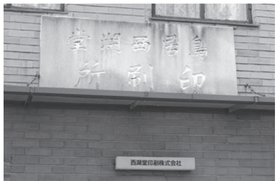
図8 西湖堂印刷所