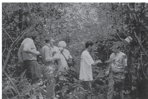
写真2 パブーン・サンクチュアリでホエザルの生態を観光するエコ・ツーリストたち

ベリーズの近接国にエコ・ツーリズムでは先進国のコスタリカという手本があるし、国内の沿岸部には世界で2番目の規模の珊瑚礁があり、また広大な未開発の土地が残り、その中にはマヤ遺跡がたくさん残っている。原生林の中にはジャガーや珍しい鳥などが棲息しているし、人里近くホエザルが群生してい