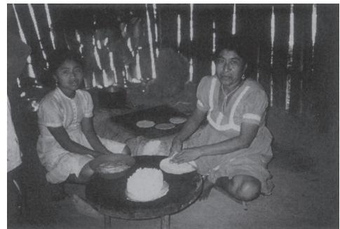
写真3 サンタ・クルスのゲストハウスの会 員の妻と娘がトルティーヤを作っ ている

ストを自分たちの家で食事させる。そして、女性を作る手工芸品を販売したり、音楽演奏（マリンバ、アコーディオンなど）や踊りができるものは、それを観光客に提供する。