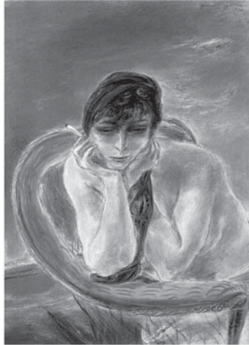
図3 国吉康雄《バンダナをつけた女》1936、福武コレクション 『福武コレクションから——国吉康雄と近代ヨーロッパの名画展』図録、p.47より