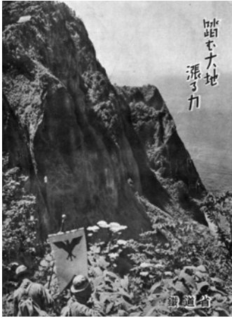
青年徒歩旅行の鐵道省ポスター （左下に三本足の烏の隊旗）

地に黒く三本足の烏を描いた隊旗を先頭に、軍隊式に行軍するもので、その第一回は相模野に向かって行進し、参加者三百人余であった。