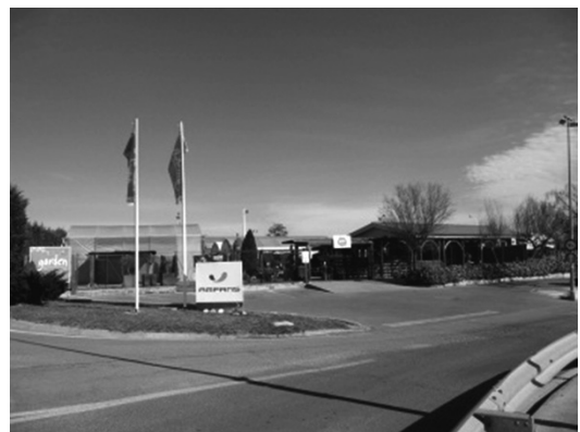
写真3 アムパンス本部の正門とガーデニングセンター

アムパンスは、社会サービスを与える民間の財団法人として、利益を得ることが禁じられていながら独自の資金源を待たなければならないが、他方で、知的障害者へ充実したサービスを与えなければならない。同財団はこの二つの要素を合わせなければならない組織であり、その組織を理解するために本論では同財団の提供するサービス、その組織及び資金源、またはバジェス地方における同財団の存在と役割について分析する。