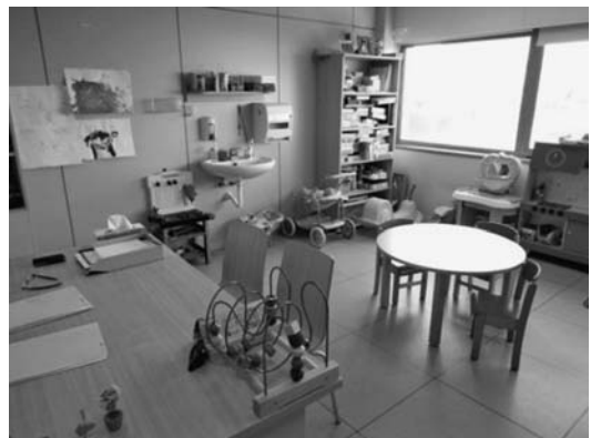
写真2 CDIAPの言語療法室

コミュニケーションと言語に問題を抱える子どもに対しては言語療育を実践している。乳幼児が対象であるため、あそびやゲームを通しての療育が中心で、部屋にはたくさんの玩具が置かれていた（写真2参照）。子どもは「お店屋さんごっこ」などを通して、ものの名前を覚えるという。また、なかなか話せない子どもたちの場合に写真カードを使ったり、口や舌の動きに問題のある子ども（構音障害）の場合には、鏡を使った構音の練習を行ったりしている。パソコンも活用しており、インターネット上にあるコミュニケーションのためのソフトウェアはよく使っているという。