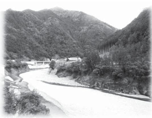
<写真 12 十津川村の写真>

性をいかに問うかという問題である。難民や移民を議論する前提としての Border control や主権国家を語る際、国民国家の境界は揺るがしがたい前提とならざるをえない。しかし十津川移民団の玉置里見の様に、北海道からさらにブラジルへと渡っていく存在もあれば、森秀太郎のように人間関係の苦悩に引き裂かれながら開拓に取り組み、最終的には離村し札幌へと移住する者もいる。開拓の「苦勞」の物語が、入植地の成り立ちを正統化する開拓のナラティブであるならば、個人の「苦悩」からこのナラティブに切れ目を入れる可能性はないか。さらに加えるならば、明治期に北海道へと旅立つ感覚から議論を始めるならば、この十津川の北海道移住の物語を、国有化宣言をされた辺境の土地を国土へと統合するだけの直線的なプロセスとして描くだけでは不十分である。森秀太郎が言うところの「異域」とは、国家の境界を出るか出ないかの非常に危うい境界線上で生活する感覚に似ている。災害移民における「個」の経験は、こうした感覚を言語化する触媒となる可能性がある。