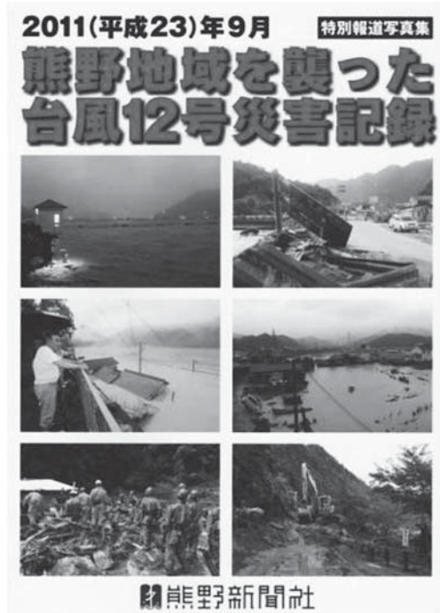
<写真2 『熊野地域を襲った台風12号災害記録』熊野新聞社>

東日本大震災が起こった同じ年の2011年9月、台風12号によって奈良県と和歌山県は深刻な被害を受けた。この台風にもなった洪水は「百年に一度の水害」と呼ばれ、山間部の村落、そして下流の新宮市などに大きな被害をもたらしている。この洪水の様子については、十津川村『十津川村大水害の記録』（十津川村、2012年）をはじめ、下流の新宮市による報告書『紀伊半島大水害 豪雨』（新宮市、2012年）や、熊野新聞社による写真集『熊野地域を襲った台風12号災害記録』（熊野新聞社、2011年）、そしてインターネット上では国土交通省の出している報告書（『2011年紀伊半島大水害国土交通省近畿地方整備局 災害対応の記録』）などによって知ることができる。