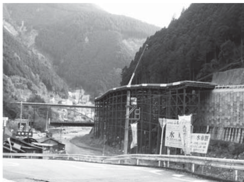
<写真3 建設作業中の道路>