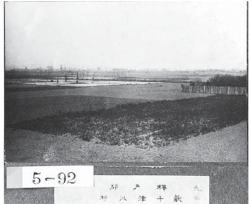
<写真10 「樺戸郡新十津川村田畑之景」1906年>