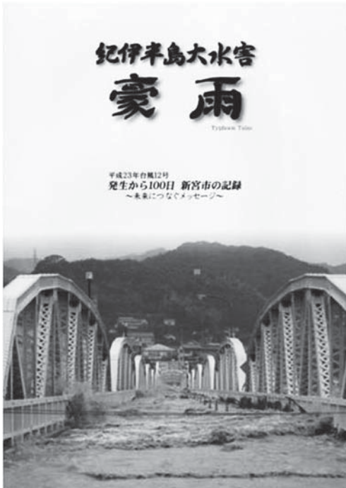
<写真1 『紀伊半島大水害 豪雨』新宮市>