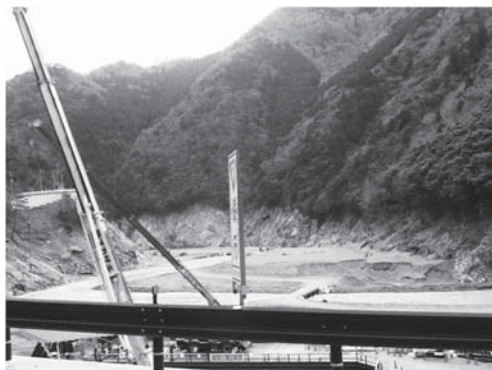
<写真4 護岸工事が続く河川>