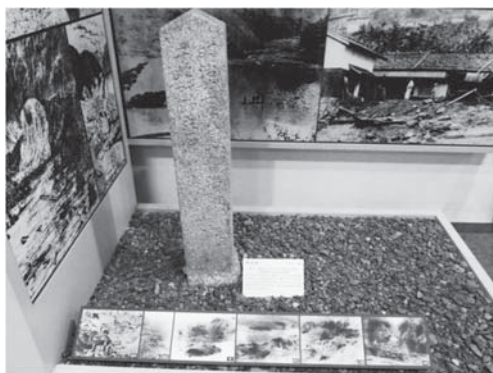
<写真5 警戒碑 十津川歴史民俗資料館にて筆者撮影>

これまで述べてきた2011年9月の大水害による深刻な被害は、1889（明治22）年に起こった大きな災害の規模を想起させる。新宮市に位置する清閑院には、約3メートルの石壁の上に1889（明治22）年の大水害の浸水位置を伝える標識が立つ。2011年の洪水ではこの標識より1.5mほど水位が低かったため、近年起こった水害のすさまじさに輪をかけて、明治期の洪水の経験を改めて考える機会となっている 3) 。十津川村においては、1889年8月18日の大水害の教訓として、村内各地に増水した地点を示す「警戒碑」が建てられており、現在も5カ所に残っている。この碑は明治期の洪水が及んだ地点を示し、十津川村の住むのちの子孫へと警戒を促すためのものであるが、災害後の河床の上昇やダム建設、道路の拡張工事などによって多くは行方不明である 4) 。「警戒碑」の一つは、十津川歴史民俗資料館において保存されており、明治期の「十津川大洪水」を伝える写真とともに展示され、洪水被害の実態を伝えている。