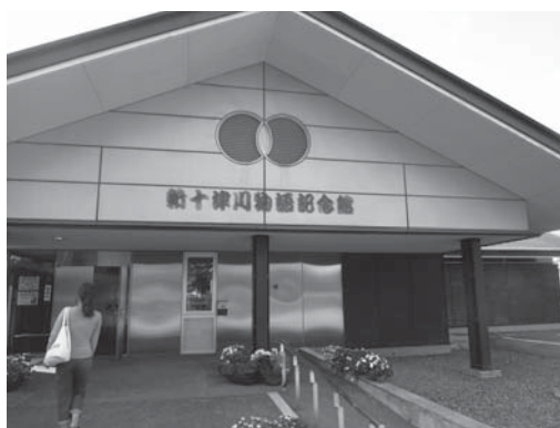
<写真 11 新十津川物語記念館>

十津川の北海道移住を扱った作品は多い。奈良県五條市出身の作家・川村たかしによる作品『十津川出国記』は歴史資料を使った記録文学として評価が高い作品である。本稿では作品全体を詳細に検討することはできないが、この時期の十津川村で移住するか残存するか村内で議論が混乱するなかで、北海道への移住へと大きく傾ききっかけとなった旭川の平原に離宮をたてて「北京」とし天皇を迎える計画があるという噂や、北海道の新十津川村において増加した富山県人の移住者に対して十津川系住民とのあいだの文化的な優越感と従属関係など多くの論点が作品内に存在する 14) 。川村たかしは、この十津川村の北海道移住を扱った全10巻に及ぶ小説『新十津川村物語』（全10巻、1977-1988年）を執筆しており、同作品はNHKドラマ『新十津川物語』として1991年に放映されている。