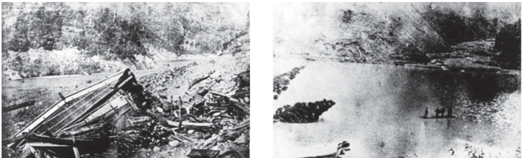
<写真6・7 罹災した十津川郷の様子>

水害後の十津川村内でもハワイや北海道などが移住先として議論されている 6) 。村自体がその機能を残したまま移民する目的、そして東京在住の十津川出身者の働きかけもあり十津川村の移住先は北海道へとなる。東京在住の十津川出身者が1889年9月の東京、北海道庁長官（永山武四郎）に移住に協力することを要請し、その後、1889年10月16日内閣総理大臣、もと北海道開拓使長官の黒田清隆によって「奈良県下罹災人民北海道へ移住の件許可す」との許可が降り、同時に移住費用として3万8千171円40銭が議会で可決される。同じように水害で被災した他の地域と異なり、「北海道移住」という選択が政府内で非常に大きく注目されていた。