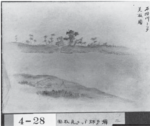
<写真9 松本十郎スケッチ画「石狩川トック見取図 (樺戸郡)」1876年>