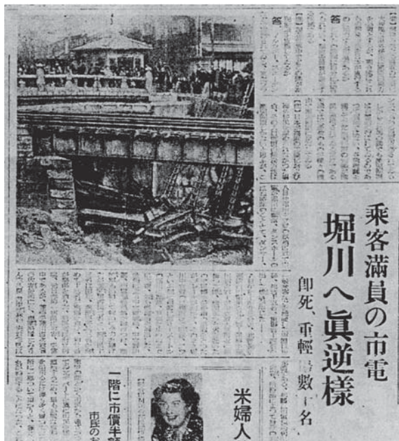
京都新聞、1946年2月9日付記事

断片的証言のほかに、都市伝説のようにして語り継がれた事件もある。1946年2月8日午後11時に市電北野線を走っていた満員の通称チンチン電車が、堀川をわたる鉄橋で脱線、転落し、米兵をふくむ11名の死者と多数負傷者がでた。小さな車両が、さほどの高さではない堀川に落ちたのであるが、犠牲は大きかった。この事故は未だにいろいろな形で語り継がれている。ふだん市電は利用しない進駐軍が終電車に乗っていたのは上七軒の歌舞練場が接収されてつくられた北野キャバレーからの帰りだったからである。酔っぱらった「シンチューグン」が、女性運転手にいたずらをしかけ、そのために手回しブレーキを回すことができなかったのだ。など