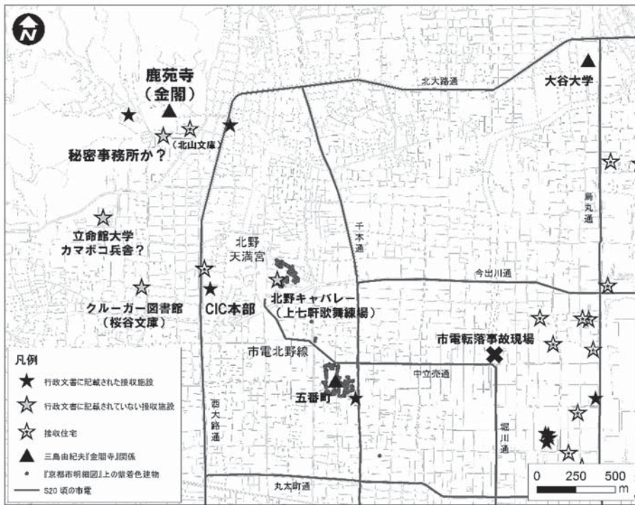
占領期の金閣寺界隈地図

(『京都市明細図』(京都府立総合資料館所蔵), 京都府文書, 京都市編 (1975)『京都の歴史8』(学芸林社)および本論文をもとに西川祐子と河角直美が作成。)