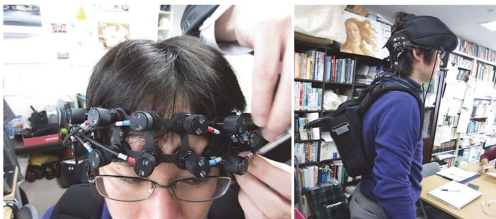
図2 LIGHTNIRS に 2 × 8 フレキシブルキャップを使って 21 チャンネル全てにプローブを装着した状態