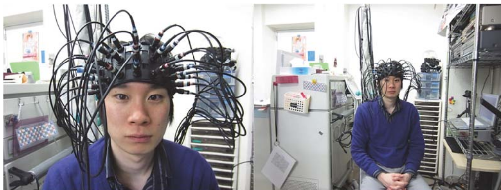
図1 OMM-3000 に 3 × 9 フレキシブルキャップを使って 42 チャンネル全てにプローブを装着した状態

OMM-3000 と LIGHTNIRS は島津製作所により開発された、近赤外光を用いて非侵襲的に脳賦活を間接的にヘモグロビン濃度と光路長により計測する光脳イメージング装置である。OMM-3000 がコピー機の上にモニターを乗せたほどの大きさがあるのに対して、LIGHTNIRS はバックパックに本体が収納できるサイズ (縦横 25 × 20 センチで厚みが7センチ) であり、被験者への物理的・心的負担は相当異なる。