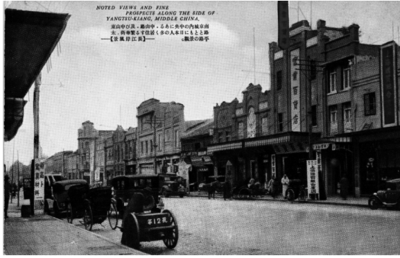
写真1 「日本人街」の繁華街、太平路

注1：右から1軒目に「上海購買組合支店」、2軒目に「実業百貨店」の看板が見える。『支那在留邦人名録』の29版中支版（1939年）、30版中支版（1940年）、31版中支版（1941年）、32版（1942年）に照らしてみると、「上海購買組合」は、1939～1941年頃に太平路10-12号と下関に店を構えており、1942年には下関の店舗だけが記載されている。「実業百貨店」は1939年に太平路14号と昇州路に出店しており、1940～42年には同住所で「白木実業公司」として記載されている。このことから少なくとも1939～1940年頃の太平路の風景であると考えられる。