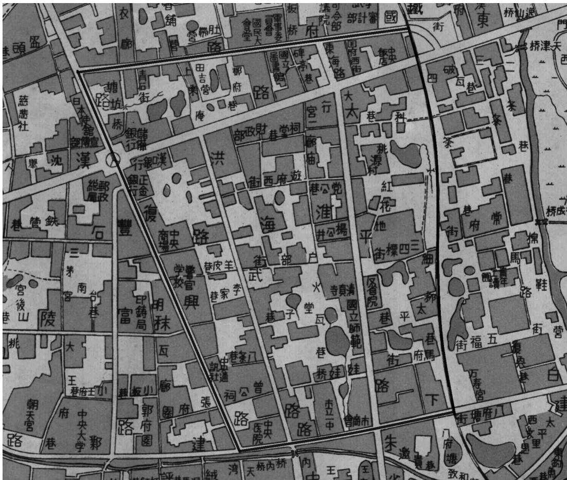
地図2 南京の「日本人街」

「日本人街」の具体的な範囲が示されるのは、1938年2月の南京特務機関の報告資料によってである。南京特務機関によれば、「日本人街」は「北八国府路ヨリ南ハ白下路ニ至リ西ハ中正路ヨリ東鉄道線路ニ達スル一帯ニシテ中ニ太平路及東中山路ノ繁華街ヲ含ム」 29) 範囲で、面積は約220町歩 30) だという。当時の「南京市市街図」（地図1）を見ると、城壁に囲まれた市街地の中心に東西と南北