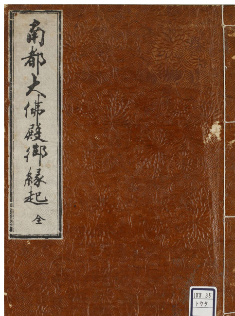
図3 東大寺大仏殿縁起版本 表紙 天明3年 奈良県立図書情報館 DIG-NAKT-12

公慶の努力が報われ、諸国勸進と幕府の援助によっ て元禄5年(1692)に大仏の開眼供養が行われ、宝永 6年(1709)に大仏殿の落慶法要が行われた。