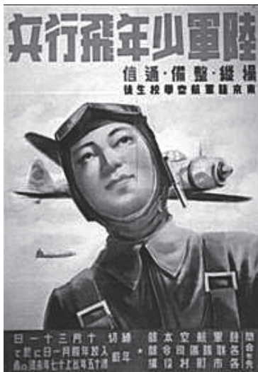
図1 陸軍少年飛行兵募集ポスター

日本政府は1933年4月、航空戦力を補強するために「陸軍飛行学校における生徒教育に関する勅令」を公布し、初等教育を終えた満14歳から17歳を対象とした少年航空兵制度を新設して募集に入った。入校した少年飛行兵は、無料で1年間の基礎教育と2年間の操縦・整備・通信分野の専門教育を受け、卒業すると下士官に任ぜられ部隊に配属された。1934年2月1日には少年航空兵第1期生170名が、1935年2月1日には第2期生260名が入校する1年に1回の募集であったが、1938年からは1年に2回の募集となり、募集人数も増えた。身体検査と学科試験による入学選考は、もちろん厳しかった。飛行機乗りとしての適性が重視され、血圧などの健康診断に加え、飛行機操縦が可能か否か判定する身体検査が実施された。