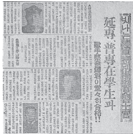
図4 朝鮮人学徒の特操1期生合格を報じた記事 出典：『毎日新報』1943年9月17日

特操は応募者の身体検査と口頭試問を課したが，朝鮮人学生が合格することは極めて困難だった。『毎日新報』は，特操1期生採用試験に合格した，延禧専門学校(現在の延世大学校)の学生と普城専門学校(現在の高麗大学校)の学生を大きく取り上げている。