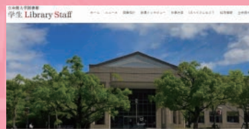
▶ 学生ライブラリースタッフホームページ