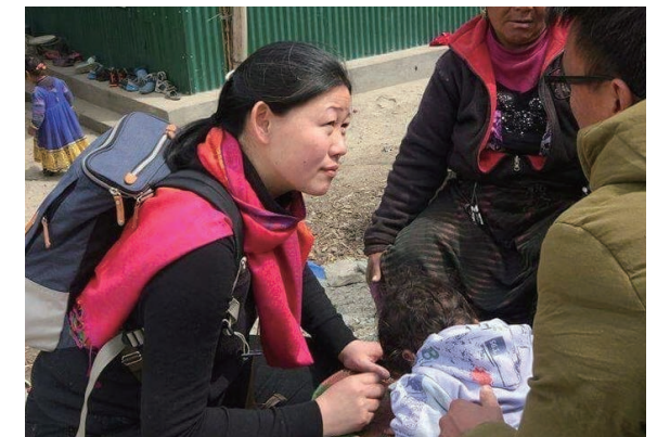
Interviewing victims in the aftermath of the 2015 Nepal earthquake about China's humanitarian assistance (at a village near the Nepal-Tibet border)

Look at the stars, not the lines in the constellation. Observe the dams and roads that have actually been built, and listen to the stories that residents tell. These are the “facts” (i.e., raw data, called primary sources), which we can see, touch, and listen to. It is fundamentally important to the core of any research to check your “facts”.