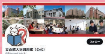
▶ 立命館大学図書館公式Twitter