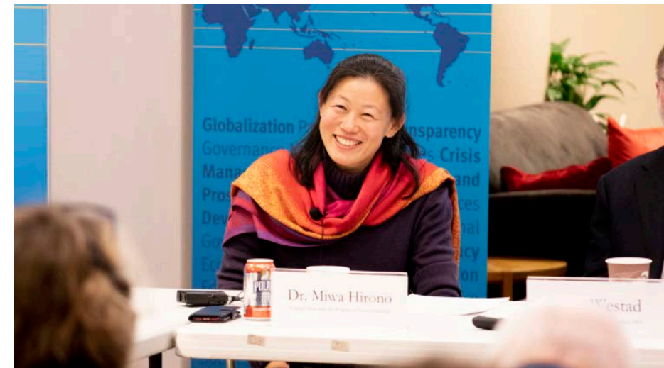
Presentation on “China and the World Order in Transition?” at the Ash Center at Harvard Kennedy School

I learnt that what I like to do, what I can do, and what I can learn from interacting with others, do not change irrespective of the physical environment I am in. What you seek is more important than where you are. This way of thinking, I believe, opens up the world to you. And now I cherish my life in Japan, to which I returned suddenly, under duress, and completely without a plan. I am grateful for the wonderful encounters I have had at Ritsumeikan.