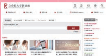
▶ 立命館大学図書館ホームページ

図書館を利用して困った時は、スタッフにお気軽にご相談ください。 また、図書館の最新情報はWEBでチェックできます！ぜひご覧ください。