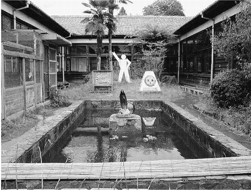
写真 9. 田山小学校中庭にある洋式庭園