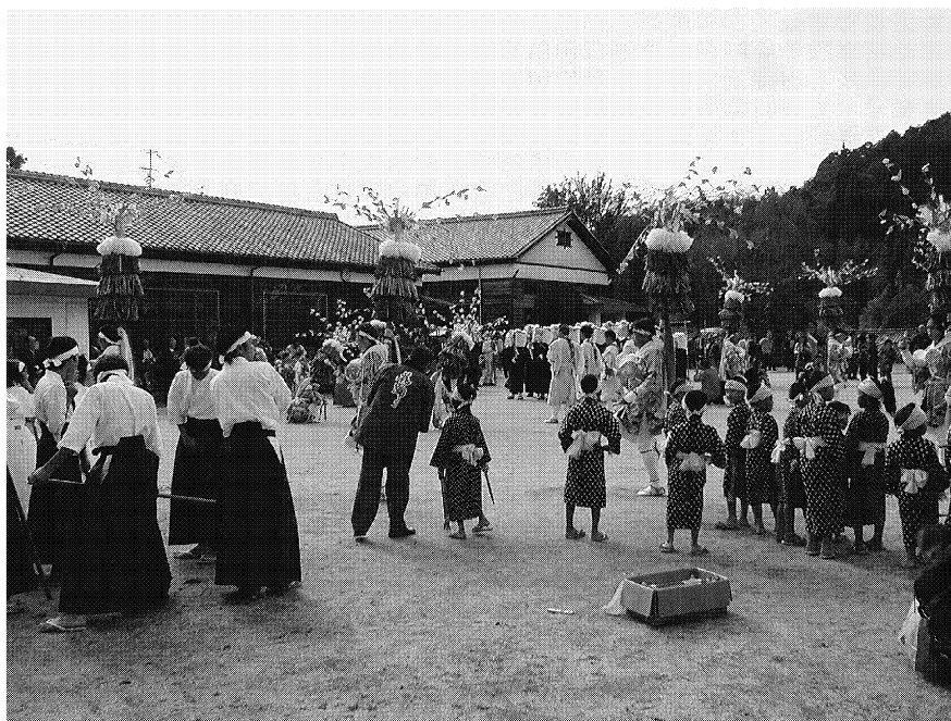
写真10. 田山小学校で行われる田山花踊り（中央奥は講堂）

ようなことで回してます。…昔はね、10月17日にずっと。だからそれはもう学校があったら、そらそこら辺は学校が調整つけてくれて、休みっちゅうか、昼から休みっちゅうことになるんすわ。それは中学校になったかって田山の子だけ早く帰れるっていうような格好で。