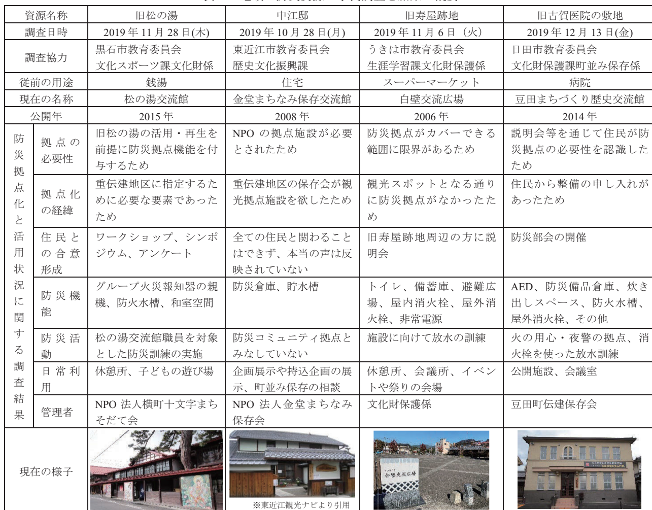
表4 地域の防災資源の事例調査と結果の概要

前節にて、事例調査の対象となる地域の防災資源を「公有建物」では、「旧松の湯」と「中江邸」、「私有敷地」では、「旧寿屋跡地」と「旧古賀医院の敷地」と示した。いずれの地域の防災資源も、平常時の利用に防災拠点としての機能を併せようと試みたことが共通点として挙げられる。そこで、事例調査では、防災拠点としての利用に至るまでの経緯及び防災拠点としての活用状況に関して、各自治体にヒアリング調査を実施した。表4に調査内容とその結果の概要について示す。