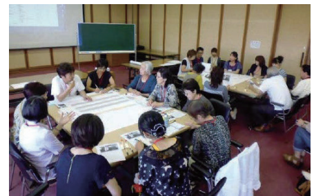
図2 活用市民ワークショップの光景 8)

旧松の湯の整備の際には、施設を長期的に有効活用してもらうため、ワークショップやシンポジウムを繰り返し開催している。旧松の湯を黒石市が買い上げる以前から、こみせ保存会等の市民レベルでワークショップ（図2）が行われ、完成後も継続して施設の活用方法が検討されている。加えて、毎回同じ人がワークショップに参加して意見を交わすことにならないよう、高校生のワークショップ参加や施設利用者へのアンケート、黒石市市内10地区から意見収集を行う等、多方面からの声を集めている工夫を凝らしている。