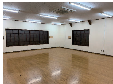
図3 白壁交流広場の備蓄庫

白壁交流広場は、オープンスペース部分と2階建ての建物部分から成る。オープンスペース部分が持つ防災機能として、一時的な避難が可能な広場、屋外消火栓がある。建物部分は、1階がトイレ、2階が備蓄庫（図3）となっており、屋内消火栓と非常電源も設置されている。建物部分に関しては、平成16年から平成21年にかけて重伝建地区内の5ヶ所（白壁交流広場を含む）で、同様の構造の建物が防災拠点として整備されている。