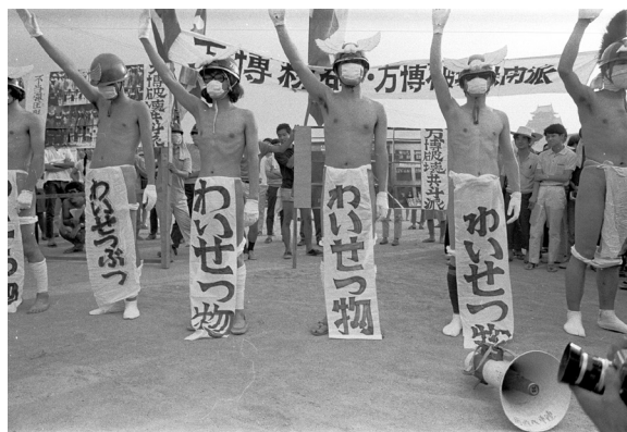
写真4 万博破壊共闘派のパフォーマンス

大阪府警が待機しており、公安警察やアメリカのCIAがさまざまな形でスパイを会場の中に入れておりましたので、何かトラブルがあったり、違法行為があれば、それを口実にすぐさま機動隊が入ってきて戦闘機の残骸を持って帰ってしまう可能性がある。だから、悪いけれど絶対ちんちん見せたらあかんで、警察が入ってくる口実はつくってくれるな、これだけは守ってくれ、君らが表現の自由について主張するのは構わないけれども、この戦闘機だけは絶対に我々としては守りたいから協力してくれと説得しました。