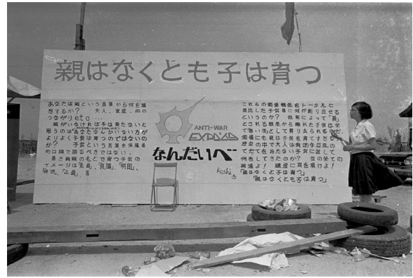
写真1 なんたいべ（南大阪ベ平連）のパネル