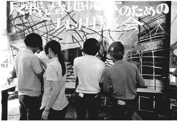
写真5 福岡ベ平連のテント内に展示された九州大学に墜落したファントムの絵