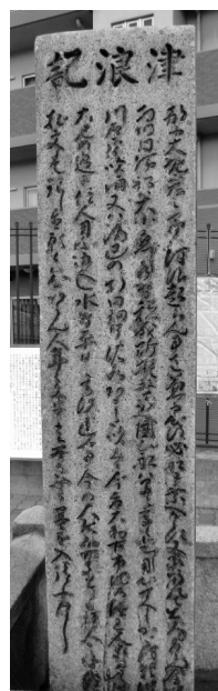
写真1 大地震両川口津浪記・石碑（南面）最後の一行に「願わくハ心あらん人、年々文字よミ安きやう墨を入給ふへし」を刻んでいる。

地元の幸町三丁目西では、この石碑を「お地藏さん」として祀り、毎年、地藏盆に墨入れをおこなって供養してきた。地元では通常地藏盆供養だけではなく、津波犠牲者の供養もおこなってきたのである。筆者は幸町三丁目・増井家に所蔵される史料『大津浪五十念忌入費帳』と『大津浪五十念忌寄附金人名簿』によって、明治三六年（1903）九月二四日（彼岸中日）に安政大津波の五十回忌法要がおこなわれたことを報告した 2) 。この法要が営まれた7年前、明治二九年（1896）六月十五日、