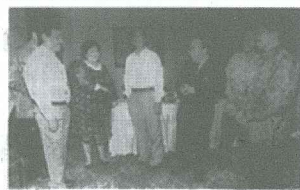
立命館大學亞洲太平洋大學校長坂本和一（左二）與印尼教育界人士在雅加達舉行記者招待會。

外，還以通欄大標題刊登了《為紀念創校100周年，學校法人立命館創辦新大學》一文。