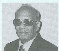
印度扎哇哈拉魯大學