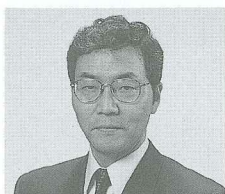
學校法人立命館常務理事〔主管教學事務〕 立命館亞洲太平洋大學副校長〔候任者〕 理學博士、教授