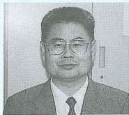
立命館亞洲太平洋大學設置 委員會事務局長