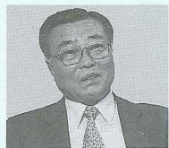
立命館亞洲太平洋大學設置委員會顧問 立命館亞太大學亞太學研究所副所長 原韓國環境廳副廳長