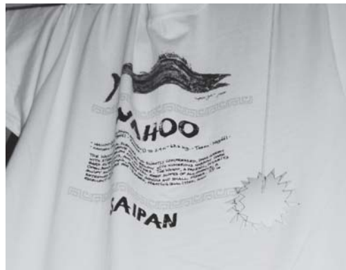
図5 サイパンで販売されている wahoo 柄の Tシャツ

なお、wahooという単語はチャモロ語起源というわけではない(語源辞典を調べると由来が「不明」とあるが、初出は大西洋地域なので、太平洋系の言語ではないようである)。しかし、サイパンへ行くと、wahooがTシャツの柄となっているほど馴染みの深い魚であると言える(図5)。