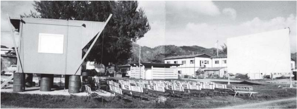
図4 米軍統治時代の父島にあった野外映画館「ワーファー」

もサイパンでもよく使われている単語である。米軍時代の小笠原には野外映画館があった(図4)。(現在の生協の西側にあったこの映画館は、元々カマボコ兵舎のカバーがついていたが、それが台風吹き飛ばされて、結果的に野外映画館になったのである。)その映画館の名前は「ワーファー」となっていた。それほど米軍統治時代の欧米系島民にとってワーファーが馴染み深い言い方なのである。