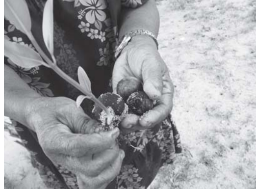
図3 パラオの tamana の木の葉と実

ハワイには tamani という木がある。同じ木は小笠原とパラオの両方でタマナ ( tamana ) と呼ばれている。パラオで言う tamana (図3) は小笠原で言うタマナは同じ木（あるいは極めて近い種）に思われる。