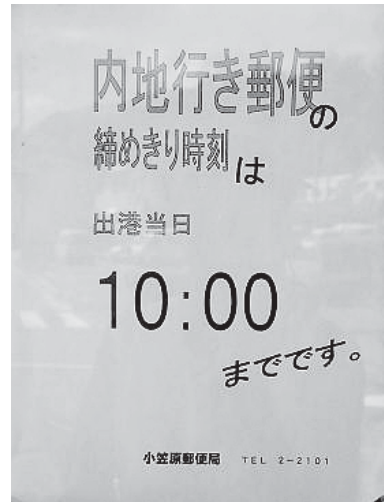
図1 内地行き郵便物の締め切り時刻を告げる郵便局の貼り紙

小笠原はいまだに「カッター」という単語が欧米系の日本語で使われている。これは「活動