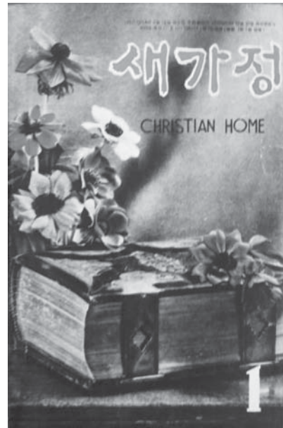
【図2】『새가정 (新家庭)』1964年1月号 表紙(カラー)ハングル

その後1975年8・9月号、1976年11月号では、コッコジを「趣味を生かした副業」「このような副業どうですか」と、コッコジを教えることを副業と捉えている。コッコジのさらなる流行が窺える。